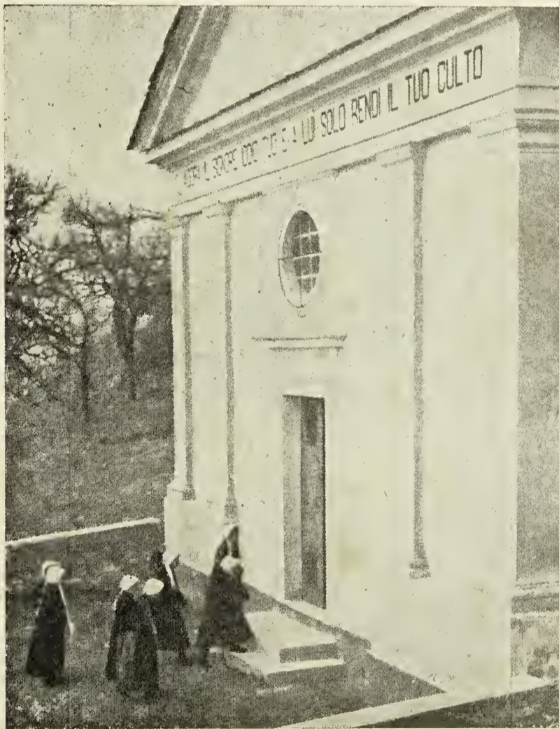
Templo E. Valdese — Maniglia